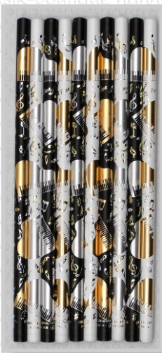
PS 26 34