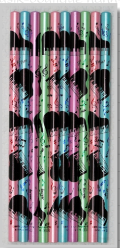
PS 27 34