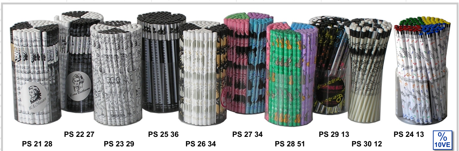
PS 21 28

mit Radiergummi als VE 5 oder Thekenbox 50 Stück (=10x VE 5).