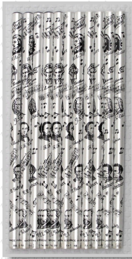
PS 23 29