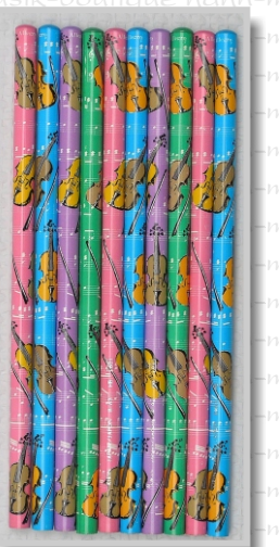
PS 28 51