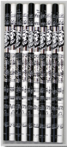
PS 21 28