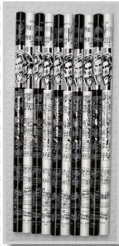
PS 22 27