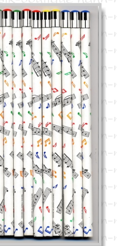
PS 24 13