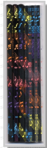
PS 29 13