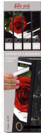
PO 23 32