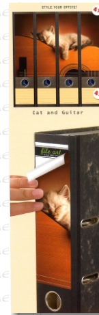
PO 21 41