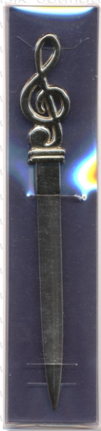
PX 10 10