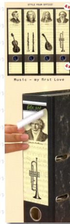
PO 20 29

Set mit 4 selbstklebenden Rückenschildern für 4 breite Standard-Ordner sowie 4 farblich abgestimmten Beschriftungsetiketten - style your office!