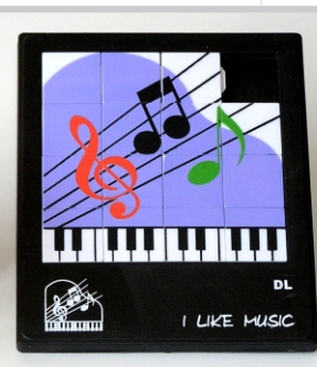
PU 02 16