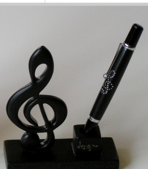
PD 15 10