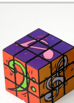
PU 01 12