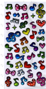
PP 30 13