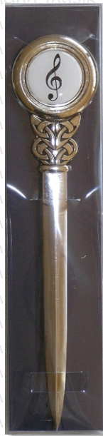
PX 11 11