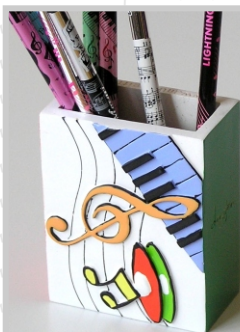
PD 16 12

Der Zauberwürfel ist ein Drehpuzzle in Würfelform, ~5x5x5cm, das Schiebepuzzle ein Schiebepuzzle, ~9x11cm. Ziel ist bei beiden Spielen, die Flächen so zu ordnen, dass sie wieder ein Motiv bilden.