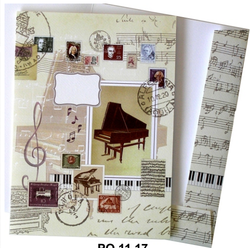
PO 11 17