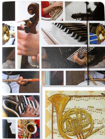
PO 10 20

mit 7,5cm Rückenbreite und 2-Ring-Hebelmechanik für A4-Schriftgut, Motiv "Music" und "Musica".