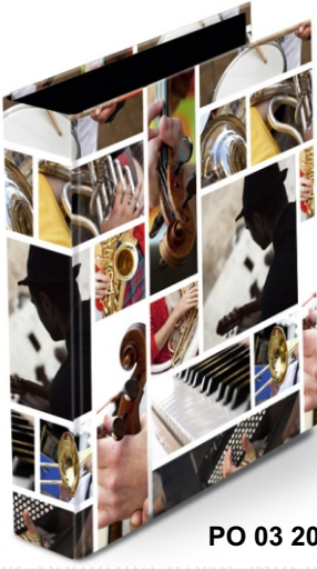
PO 03 20