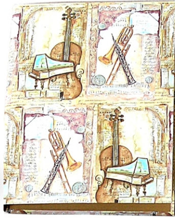
PO 04 16