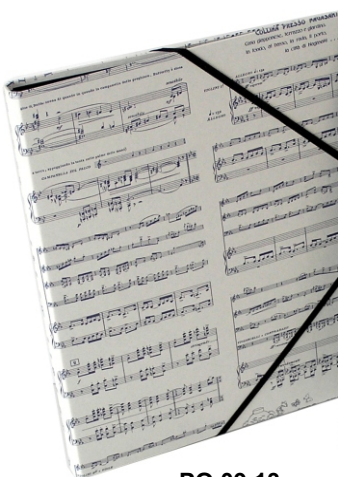
PO 09 13