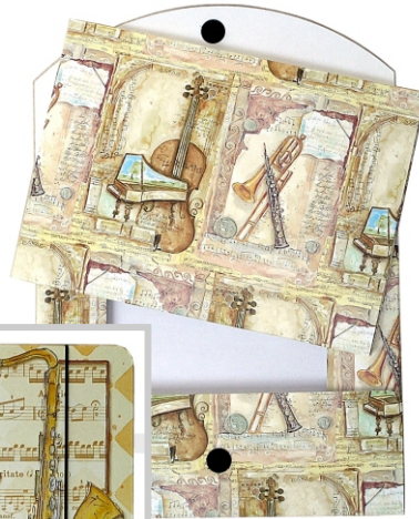
PO 06 16