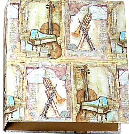
PO 05 16