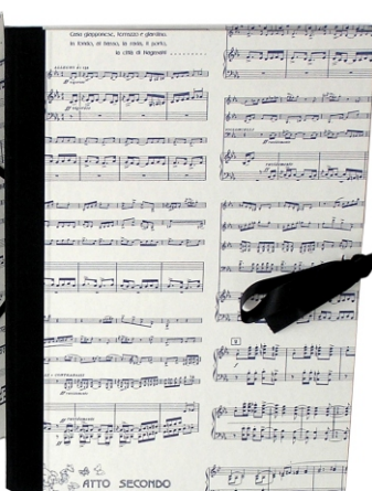
PO 08 13