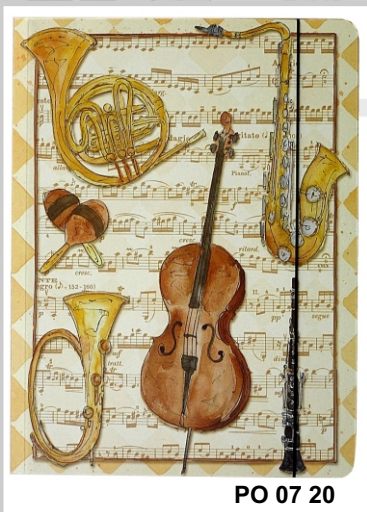
PO 07 20