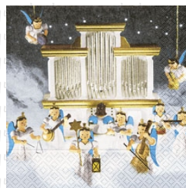
HS 3001 (L)