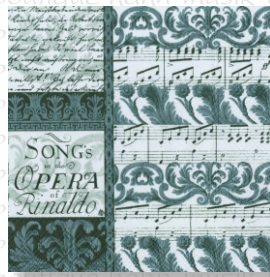
HS 0912 (L) HS 1012 (C)