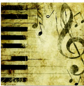
HS 3710 (L) HS 3810 (C)