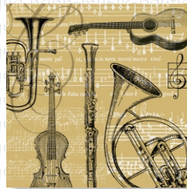
HS 3520 (L) HS 3620 (C)