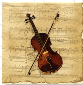
HS 2051 (L)