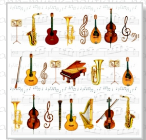
HS 3120 (L) HS 3220 (C)