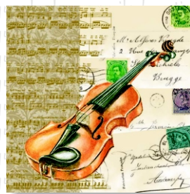
HS 3951 (L)