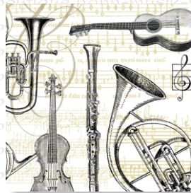
HS 1320 (L) HS 1420 (C)