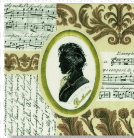
HS 1627 (L) HS 1727 (C)