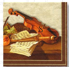
HS 0651 (L)