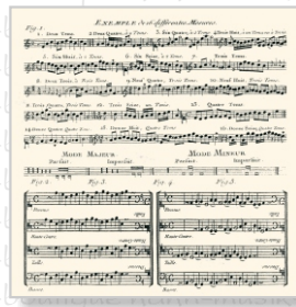
HS 2813 (L) HS 2913 (C)