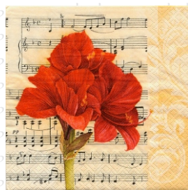
HS 0813 (L)