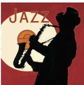
HS 3326 (L) HS 3426 (C)