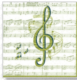
HS 0510 (L)