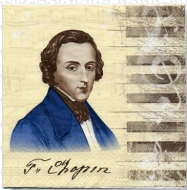
HS 1229 (L)