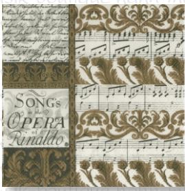
HS 0312 (L) HS 0412 (C)