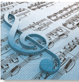
HS 01 10 (L)