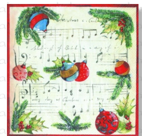
HS 2301 (L) HS 2401 (C)