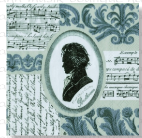
HS 1827 (L) HS 1927 (C)