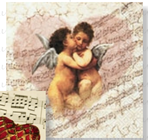
HS 1615 (L)