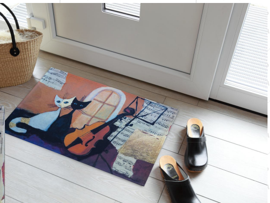
HB 61 51