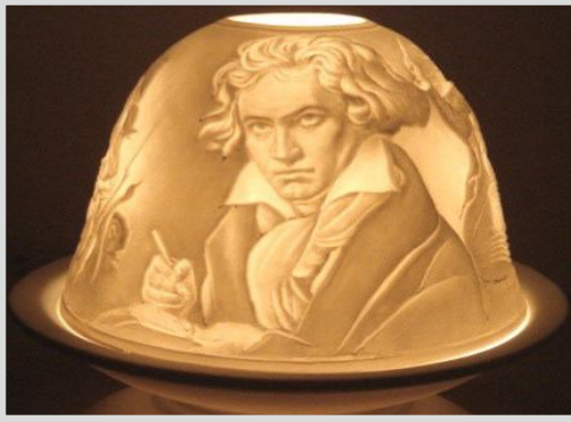
HB 30 27

aus Porzellan mit Motiven „Beethoven“ und „Mozart“, je ~8x12cm.