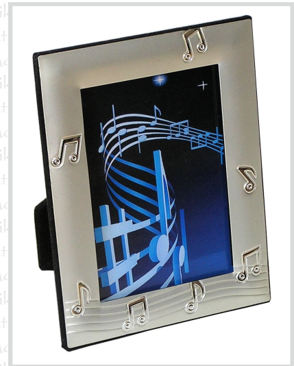
HR 10 12

13x17cm für Fotoformat 9x13cm aus Metall mit rückseitigem Aufsteller.