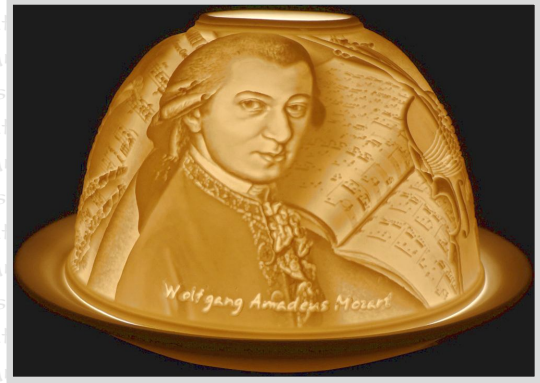
HB 31 28